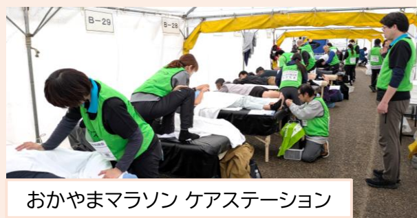
おかやまマラソン ケアステーション