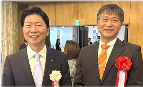
伊原木隆太知事 西谷典人