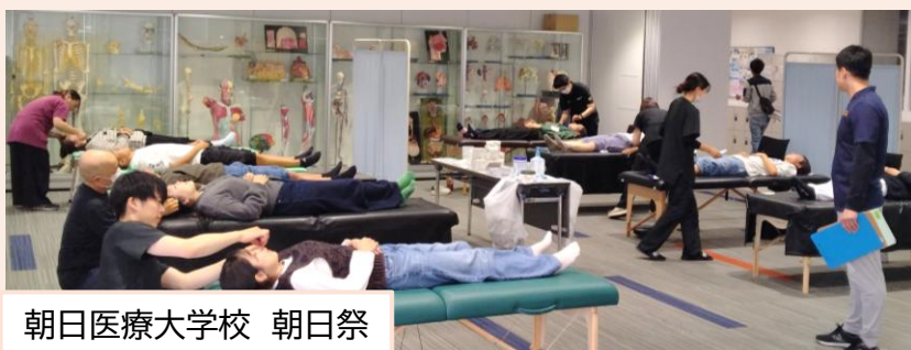
朝日医療大学校 朝日祭

★こうした取り組みは、鍼灸を知ってもらおうきっかけとして、少しずつ広がっています。